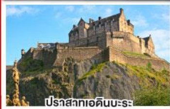
ปราสาทเอดินบะระ

เยือนสโตนเฮนจ์, และ พิพิธภัณฑน์โรมันโบราณ