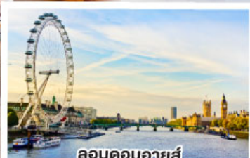
ลอนดอนอายส์