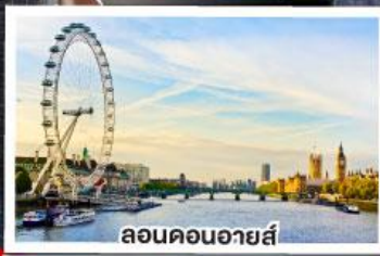
ลอนดอนอายส์

เดินทาง 12-20 ต.ค. 67 15-23 พ.ย. 67 27 ธ.ค. 67-04 ม.ค. 68 10-18 ก.พ. 68 11-19 มี.ค. 68