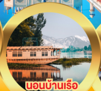
นอนบ้านเรือ วิวเขาหิมาลัย