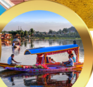
ล่องเรือซิคาร์่า