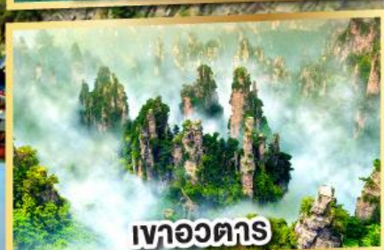
เขาอวตาร