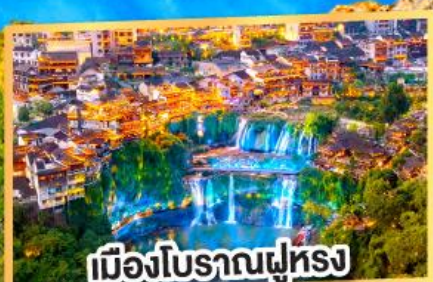
เมืองโบราณฝูหลง

ฟูหลงเจิน เฟิ่งหวง มนต์เสน่ห์เชียงซี 5 วัน 4 คืน