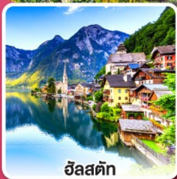
ฮัลสตัดท์

เที่ยวเก็บครบเส้นทาง สายโรแมนติก เยอรมัน จากเวิร์ชบวร์คสู่เอาคส์บวร์ค