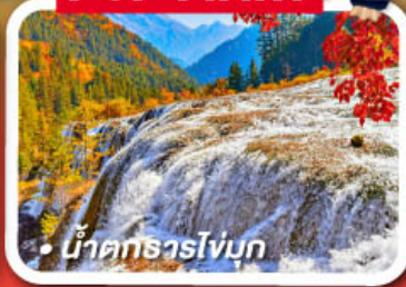
น้ำตกธารโง่บูก