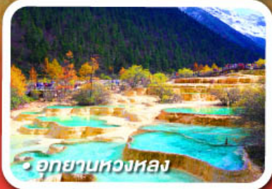
อุทยานหวงหลง