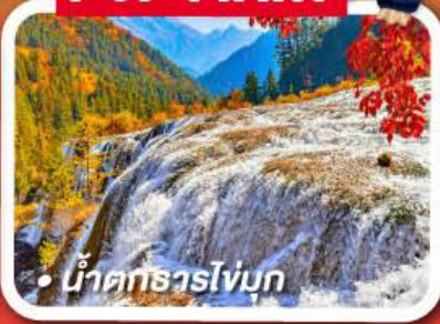
น้ำตกธารไข่มุก