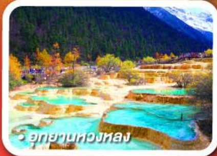
อุทยานหวงหลง