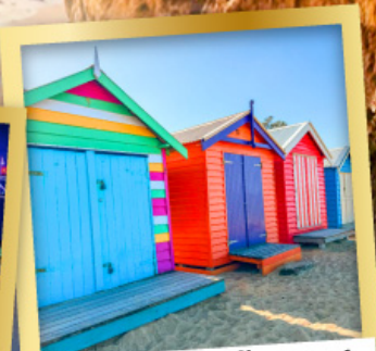
ไบรด์ตัน บาร์ตัง บ็อกซ์