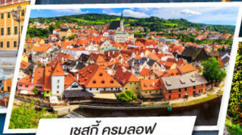
เชสกี ครุมลอฟ