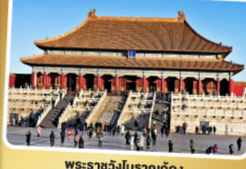
พระราชวังโบราณกู้กง