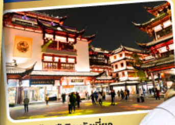
ตลาดร้อยปีเฉิงหวงเหมียว