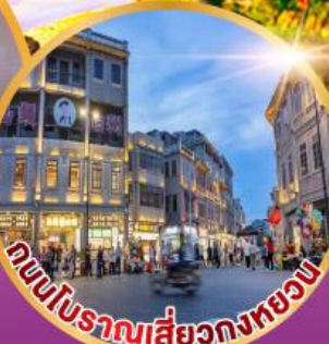
ถนนโบราณเสี่ยวกงหยวน