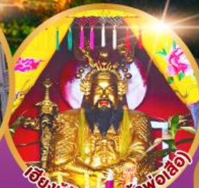
เอ็งบูซิว (ศาลเจ้าพ่อเสือ)

เมนูพิเศษ!! อาหารแต่จิว 18 อย่าง ผ่านพะไลต้นตำรับชัวเถา สุกี้ซิว