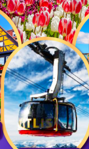
กระเช้าทิตลิส