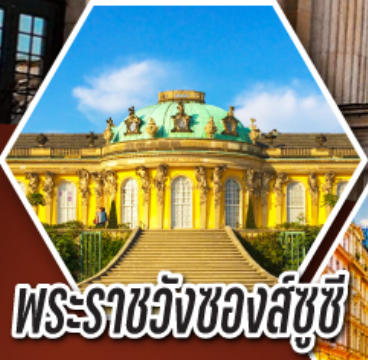
พระราชวังของสึซึ