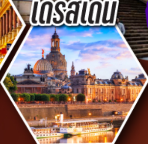
ออสเตรีย

พิเศษนี้อาหมูเยอรมันแบบต้นตำหรับ และตามรอยซีรีส์ Queen of Tears ที่กรุงเบอร์ลิน