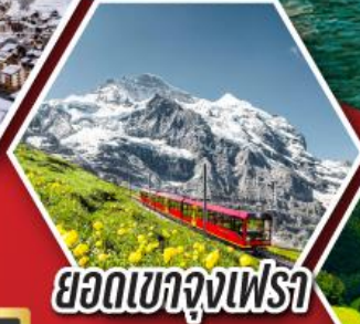
ยอดเขาจุงเฟรา