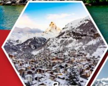
เซอร์แมท