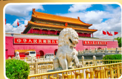
จุดริสเทียนอันเหมิน