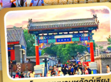
ถนนโบราณหนานหลวู่เซียง