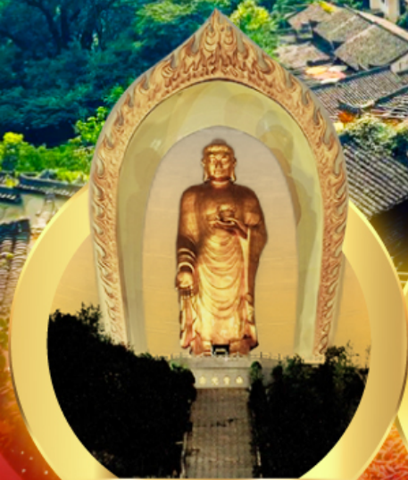
พระใหญ่ตงหลิง