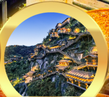
หุบเงาเทวดา