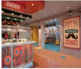
EL LOCO FRESH