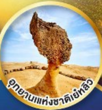
อุทยานแห่งชาติเย้หลิว