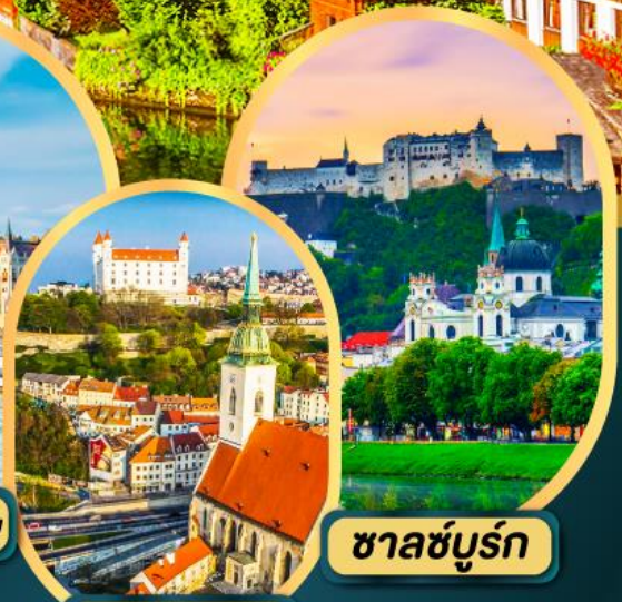
ซาลซ์บูร์ก