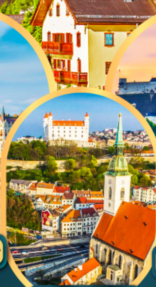
บราติสลาวา