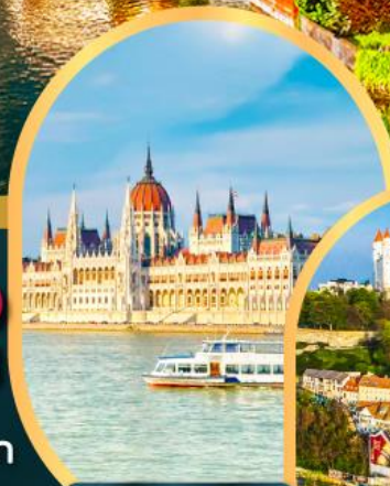
ล่องเรือแม่น้ำดานูบ