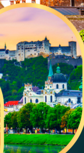
ซาลซ์บูร์ก