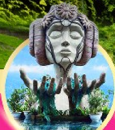
โมอาน่า ซาปา คาวี