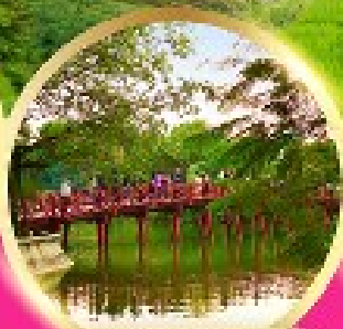
ทะเลสาบคินคาน