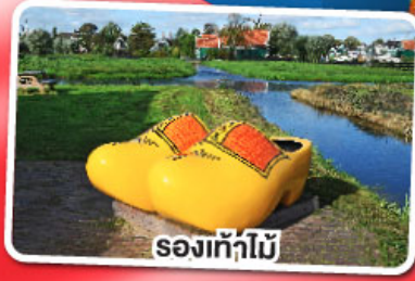
รองเท้าไม้