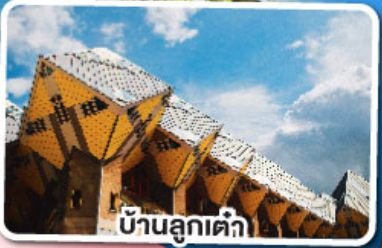
บ้านลูกเต่า