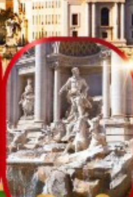
น้ำพุเทรวี่