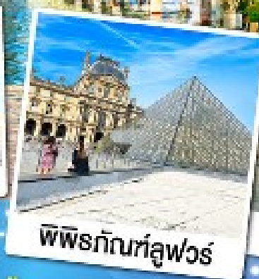
พีระกัณฑ์ลูฟวร์