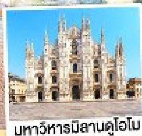
มหาวิหารมิลานดูโอโม

23-29 ก.ย. 67 07-13, 21-27 ต.ค. 67 04-10, 18-24 พ.ย. 67 02-08 ธ.ค. 67