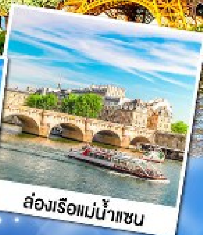
ส่องเรือแม่น้ำแซน