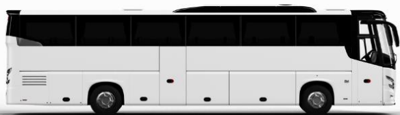
ตัวอย่างรูปภาพรถ 1 ชั้น

หากประเภทห้องที่ท่านริเวสมาเต็ม อาทิ เช่น ริเวสห้องพักเป็น TWIN BED หรือ DOUBLE BED ทางบริษัทขอสงวนสิทธิ์ในการปรับประเภทห้องพัก เป็นตามที่โรงแรมมีอยู่ โดยไม่ต้องแจ้งให้ทราบล่วงหน้า