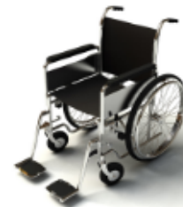
การรับการดูแลเป็นพิเศษ

กรณีผู้เดินทางต้องการความช่วยเหลือเป็นพิเศษ อาทิเช่น การใช้วีลแชร์ กรุณาแจ้งบริษัทฯ อย่างน้อย 7 วันก่อนการเดินทาง มิฉะนั้นบริษัทฯ จะไม่สามารถจัดการล่วงหน้าได้ เนื่องจากการขอใช้วีลแชร์ในสนามบินนั้น ต้องมีขั้นตอนในการขอล่วงหน้า และบางสายการบินอาจมีการเรียกเก็บค่าใช้จ่ายทั้งทางสนามบินในไทยและในต่างประเทศ ซึ่งผู้เดินทางสามารถสอบถามกับเจ้าหน้าที่ได้โดยตรงก่อนทำการจอง และหากในขณะของท่านมีผู้ต้องการดูแลพิเศษ เช่น ผู้ที่นั่งรถเข็น (Wheelchair), เด็ก, ผู้สูงอายุและผู้ที่มีโรคประจำตัวหรือไม่สะดวกในการเดินทางท่องเที่ยวในระยะเวลาดำเนินการกว่า 4 - 5 ชั่วโมงติดต่อกัน ท่านและครอบครัวต้องให้การดูแลสมาชิกภายในครอบครัวของท่านเอง เนื่องจากการเดินทางเป็นหมู่คณะ หัวหน้าทัวร์มีความจำเป็นต้องดูแลคณะทัวร์ทั้งหมด