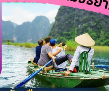
นั่งเรือกระจาด