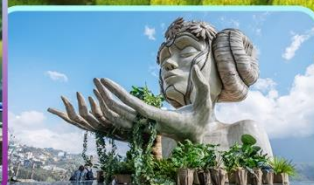
Moana Sapa Cafe