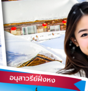
อนุสาวรีย์ผึ้งหง