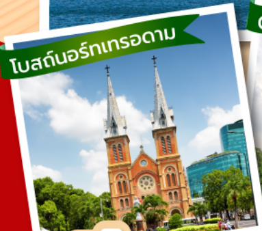
โบสถ์นอร์ทเทรอดาม