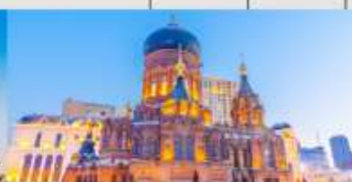
โบสถ์เซนต์โซเฟีย