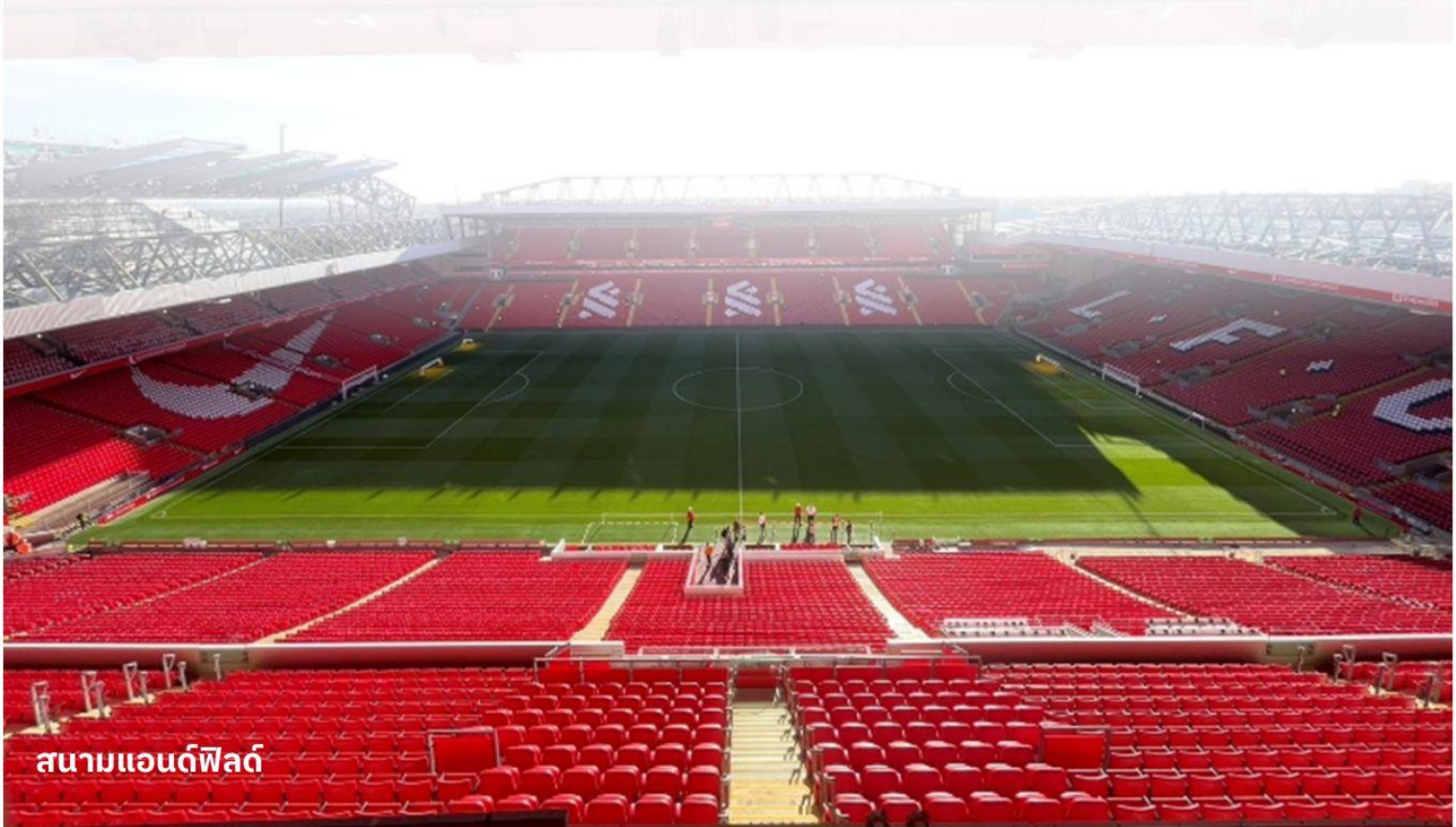
สนามแอนฟิลด์

หนึ่งในสถานที่ท่องเที่ยวที่ใหญ่ที่สุดในเมืองลิเวอร์พูล โดยบริเวณท่าเรือนั้นประกอบไปด้วยอาคารท่าเรือและคลังสินค้า นอกจากนี้แล้วท่าอัลเบิร์ตยังเป็นสถานที่ท่องเที่ยวที่มีคนเข้าชมมากที่สุดในสหราชอาณาจักรอีกด้วย