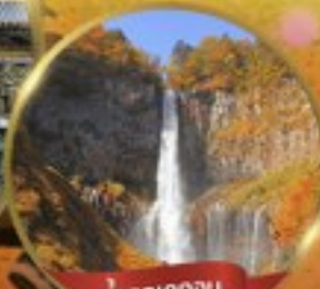
น้ำตกเคกอน