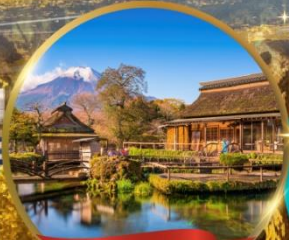
หมู่บ้านโอชิโนะฮักโก