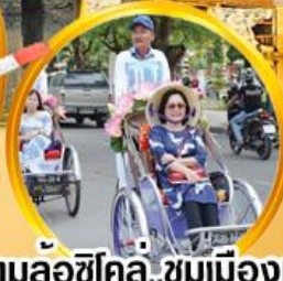
สามล้อซิคิลี่ ชมเมืองเก่า