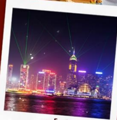
ชมโชว์ SYMPHONY OF LIGHT