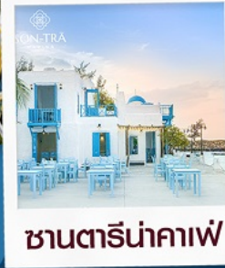
ซานตารีนาคาเฟ่