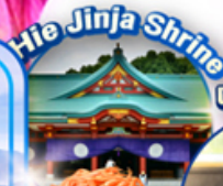
Hie Jinja Shrine