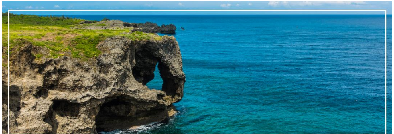
CAPE MANZAMO ผามันซาโมะ

จากนั้นนำท่านเดินทางสู่ ผามันซาโมะ (Cape Manzamo) (ใช้เวลาเดินทางประมาณ 1.20 ชั่วโมง) ผาหินที่สูงชันกว่า 30 เมตรมีลักษณะคล้ายวงช้างหันหน้าสู่ทะเลจีน พื้นที่สีเขียวของต้นหญ้าที่ขึ้นปกคลุมจนถึงยอดหน้าผาตัดกับผืนน้ำทะเลสีฟ้าใส เป็นทิวทัศน์ที่สวยงามที่สุดแห่งหนึ่งในโอกินาวา ในวันที่ท้องฟ้าสดใสจะสามารถ มองเห็นความสวยงามของเกาะทางตอนเหนือและเกาะที่อยู่นอกชายฝั่ง