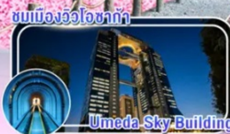
Umeda Sky Building