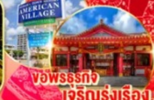
พิพิธภัณฑ์ เจ็ริญรุ่งเรือง!