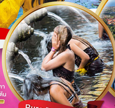
Pura Tirta Empul