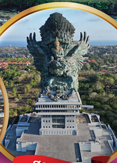
สวนวิษณุ