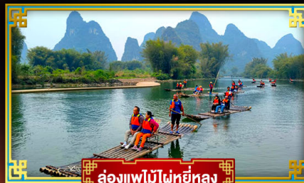
ล่องแพไม้ไผ่หยี่หลง