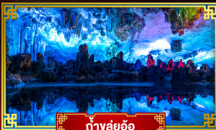
ถ้ำขลุ่ยอ้อ

"ดินแดนแห่งสายน้ำและขุนเขา" สัมผัสประสบการณ์นั่งบอลลูนชมวิวมุมสูง