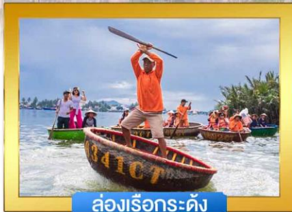
ล่องเรือกระด้ง