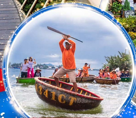
นั่งเรือกระดัง Hoi an