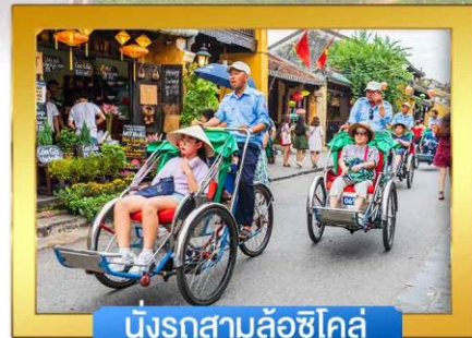
นั่งรถสามล้อซิโคล