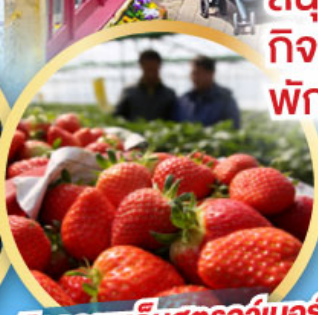
กิจกรรมเก็บสตอว์เบอร์รี่