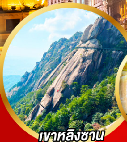
เวาหลิงซาน