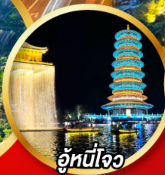
อู๋หนี่โจว