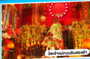
วัดเจ้าแม่กวนอิมของงำ

*นั่งรถข้ามสะพานเซินเจิ้น-จงซาน "สะพานข้ามทะเลที่สูงที่สุดในโลก"