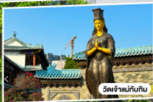
วัดเจ้าแม่กวน