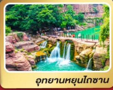
อุทยานหยุ่นโกซ่าน