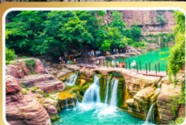
อุทยานหยุ่นโกซ่าน