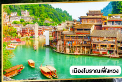
เมืองโบราณเฟิ่งหวง