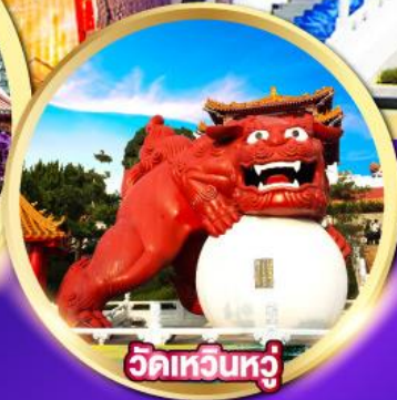
วัดเหวินหู่

โรงละครไทจง-หมู่บ้านปศาจซีโกว วัดเหวินหู่, วัดหลงซาน-ล่องเรือทะเลสาบสุริยันจันทรา พิพิธภัณฑท์แห่งชาติกู่กง-ถนนโบราณจิวเฟิ่น ช้อปปิ้งตลาดไทจง, ตลาดซีเหมินติง, Gloria Outlet