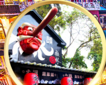
หมู่บ้านปิตาจซีโก