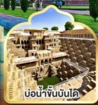
บ่อน้ำขั้นบันได