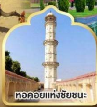
หอคอยแห่งชัยชนะ