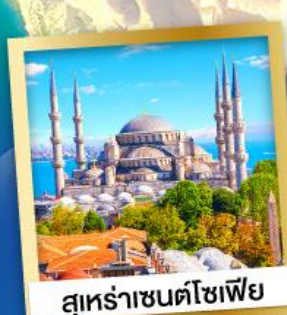
สุหระชาชนตโซเฟีย