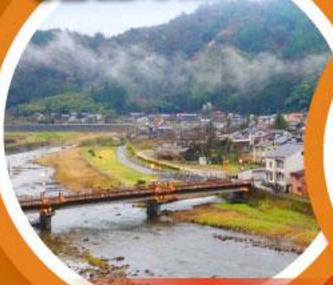
มิซาซาออนเซน

เที่ยวเต็มทุกวันไม่มีฟรีคีย์ ชมเนินทรายทตริที่ใหญ่ที่สุดในญี่ปุ่น ตามรอยกูดน้อย คิตาโร่ และโคนัน นั่งกระเช้าชมวิว 1 ใน 3 ที่สวยที่สุดในญี่ปุ่น “อามาโนะ ฮาชิคาเตะ”