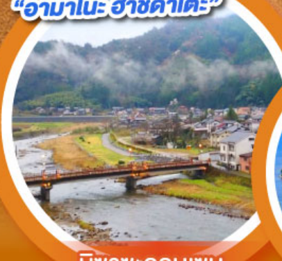
มิซาซะออนเซน