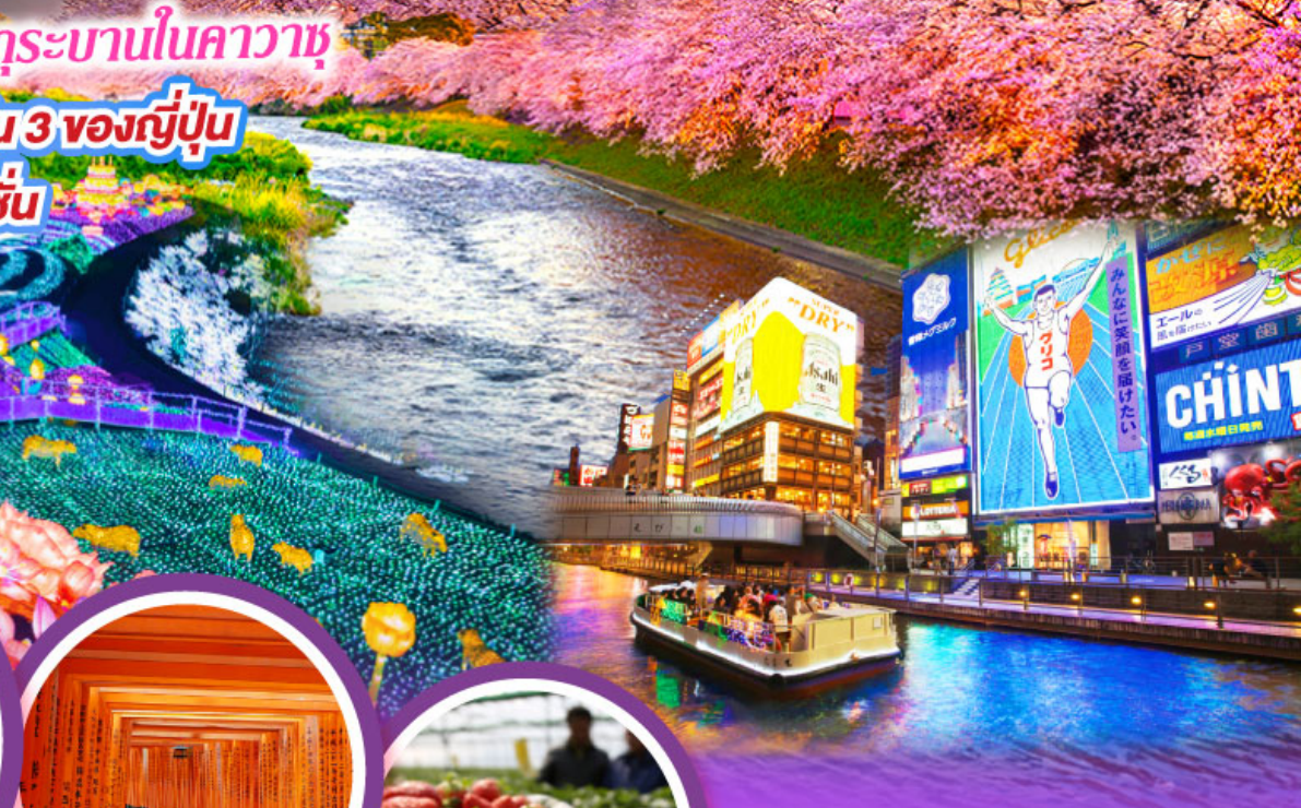
ศาลเจ้านิมบะ ยาชากะ