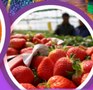
เก็บสตรอว์เบอร์รี่

เดินทาง 04-09, 06-11 ก.พ. 68 14-19, 18-23 ก.พ. 68