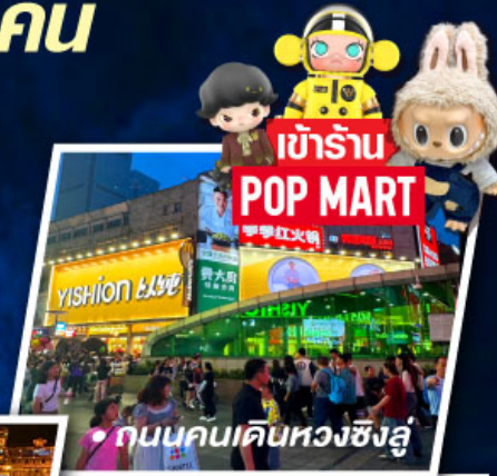
• ถนนคนเดินหวงซิงหลู