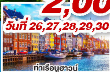
ท่าเรือฮาวน์